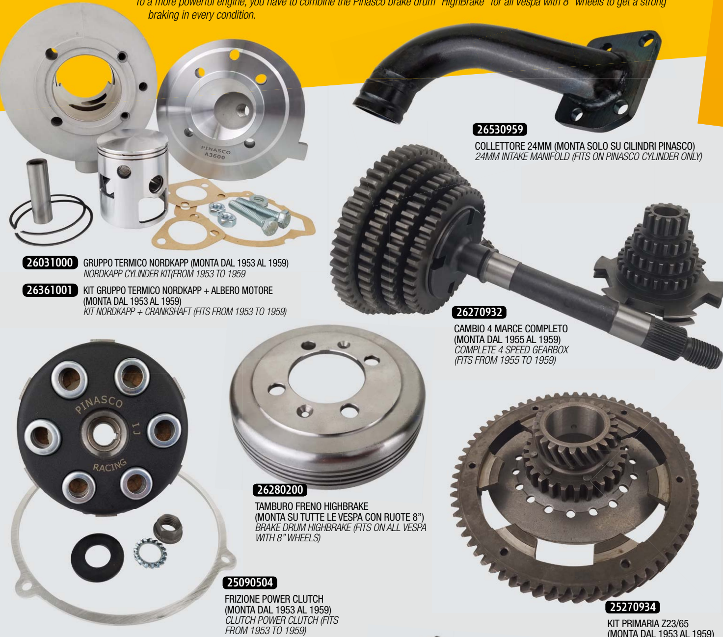
26031000 GRUPPO TERMICO NORDKAPP (MONTA DAL 1953 AL 1959) NORDKAPP CYLINDER KIT (FROM 1953 TO 1959)

To a more powerful engine, you have to combine the Pinasco brake drum "HighBrake" for all Vespa with 8" wheels to get a strong braking in every condition.