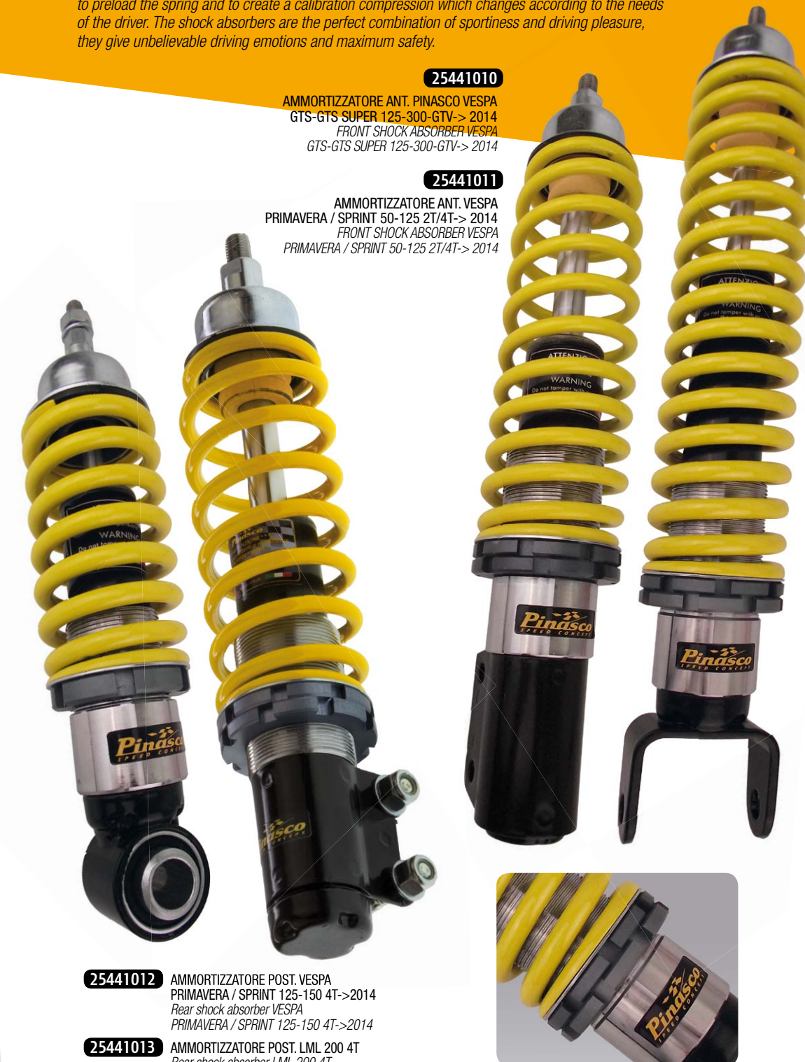
25441010 AMMORTIZZATORE ANT. PINASCO VESPA GTS-GTS SUPER 125-300-GTV-> 2014 FRONT SHOCK ABSORBER VESPA GTS-GTS SUPER 125-300-GTV-> 2014

Pinasco double-action shock absorbers represent the technological developments in the field of adjustable suspension according to European standards. The Pinasco shock absorbers are MADE IN ITALY with the highest quality material, the adjusting rings are machined from solid, steel spring support are machined CNC and chrome-plated, double action springs are made of calibrated steel. The reaction force of a shock absorber is given by the resistance that the oil contained in it encounters when passing through the valves, consisting of calibrated holes and discs. With an adjusting millimetric ring the suspension is able to preload the spring and to create a calibration compression which changes according to the needs of the driver. The shock absorbers are the perfect combination of sportiness and driving pleasure, they give unbelievable driving emotions and maximum safety.