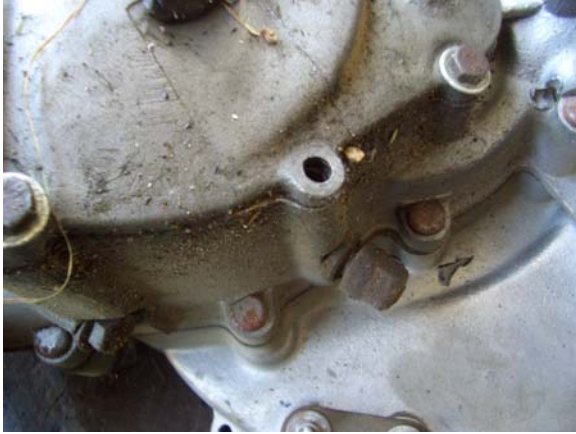
Fehlende Schraube am Motordeckel