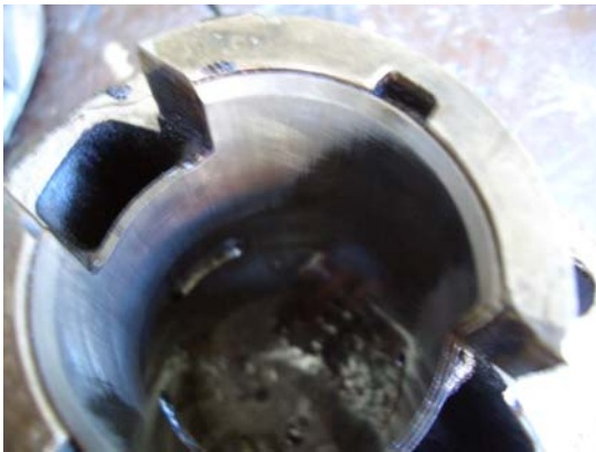
Buchse in Zylinder eingebaut