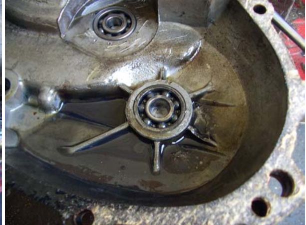
Falsche Lager eingebaut