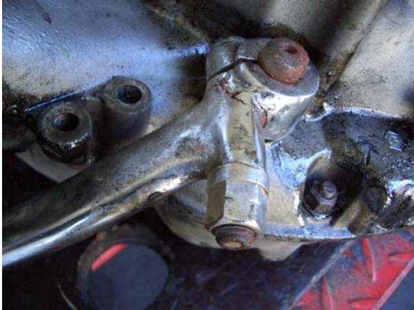
Falschen Kickstarter angepasst!